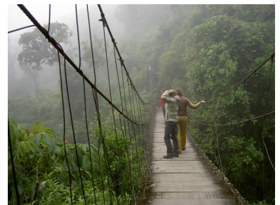
Suspension bridge in Inca Chaca