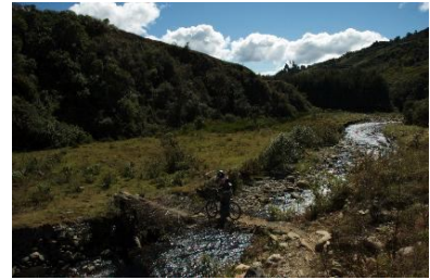
Crossing the river