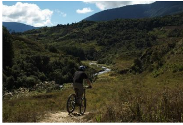
The road down hill