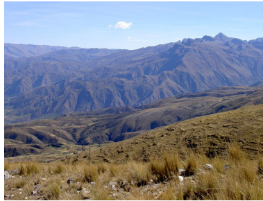
The Cordillera Tunari Mountain Range