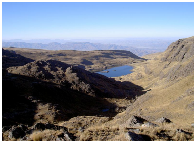
The "Laguna Huara Huara" from above