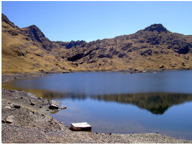
The drinking water lake "Laguna Huara Huara"