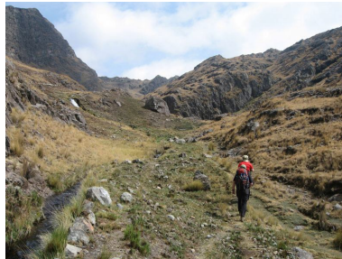
On the way up