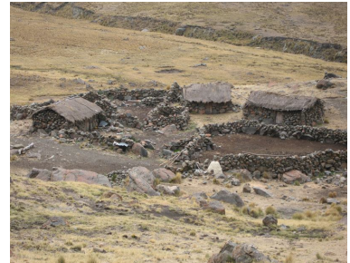
Houses of "campesinos" on the way