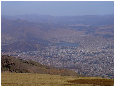
Spectacular views above the city