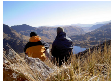
On the top