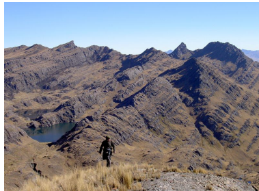
Climbing the highest peak (4.350 mts.)