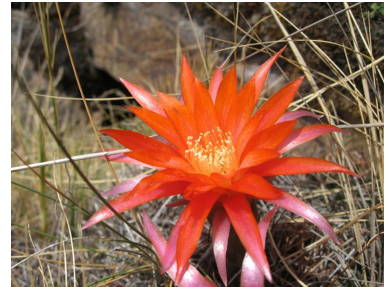
Cactus flower on the way