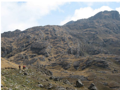
On the way back