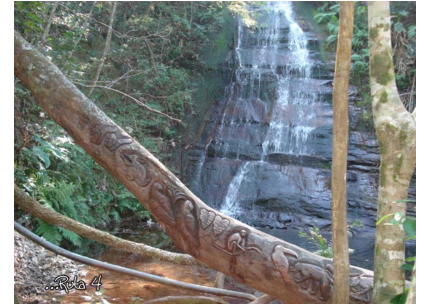
Cascada “Velo de la novia”