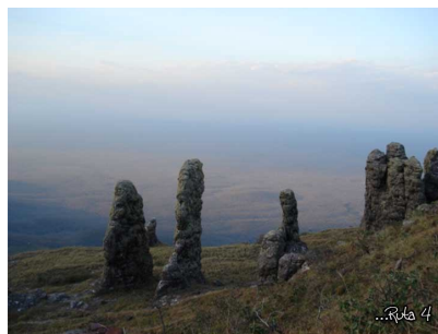
Monolitos - afloramientos de roca