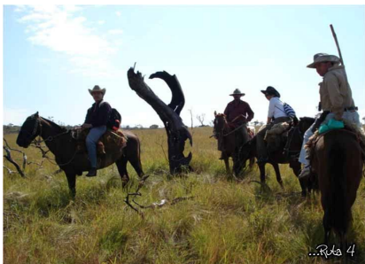
Paseo en caballo