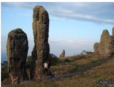
Monolitos - afloramientos de roca