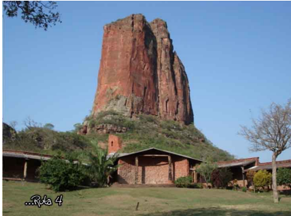
Cerro La Torre