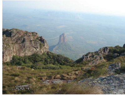
Vista del Cerro de Chochis al Cerro La Torre