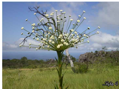
Vegetación de Santiago de Chiquitos