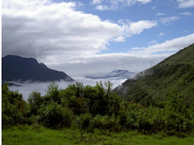
En el camino por los “Yungas de Cochabamba”