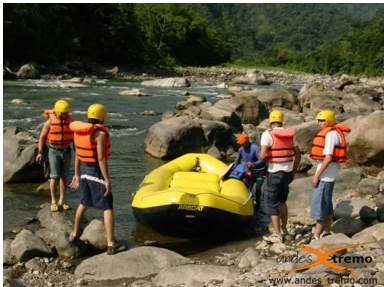
Llevando los botes al río