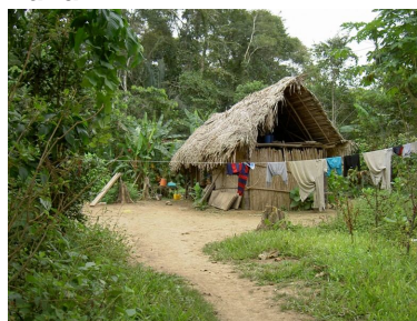
Casas de gente nativa de la zona en la orilla del río