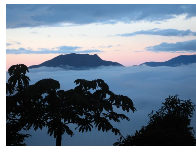
En el camino de retorno a Cochabamba