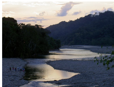
El río Espiritu Santo en Villa Tunari