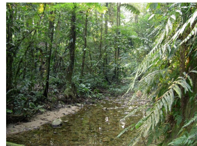
El Parque Nacional Carrasco