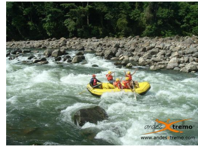
Remando en los rapidos