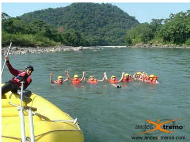
Flotando en el río