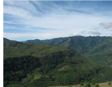
The Amboró N.P.